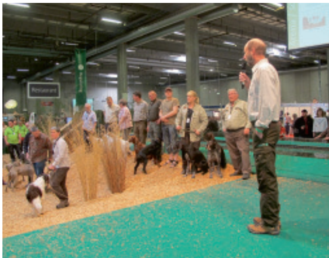
Harris løfter opgaven som speaker over jagthunderacerne i Odense Congress Center med stor ekspertise.

Se flere nyheder fra området i medlemsbladet