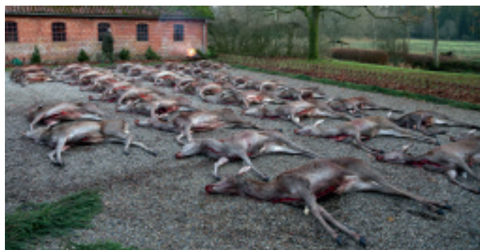
Parade i Gludsted Plantage. Her praktiserer Naturstyrelsen bevægelsesjagt med stort udbytte. Nu er ideen kopieret til Kompedal Plantage.