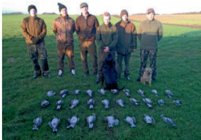
Seks ungjægere, der kun kunne være stolte af dagens jagtudbytte.

– Da vi havde brugt tre timer, holdt vi en velfortjent pause og gjorde status over, hvor mange duer, der var skudt, og om alle havde haft skud i bøssen. Det viste sig at være tilfældet, så alle var i højt humør. Da det begyndte at tynde ud i de passerende duer, blev vi enige om at holde. Det var blevet til 28 duer.