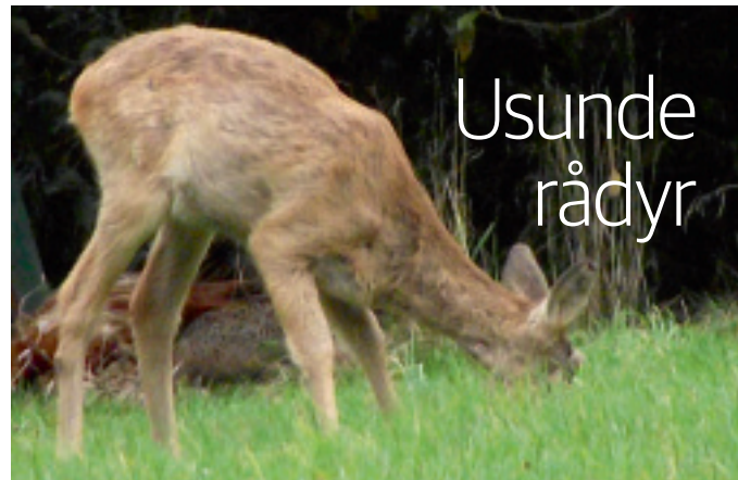
De dyr, der blev sendt til undersøgelse, lignede meget de dårlige dyr, der blev set i løbet af efteråret.

Se flere nyheder fra området i medlemsbladet