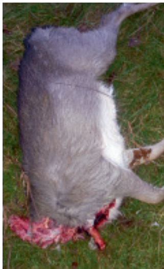
Lemlæstet dåkalv efter hunds hærgen i Dyrehaven.

– Jeg hørte en meget høj lyd, som jeg aldrig har hørt før, og ca. 10 meter borte så jeg en stor schæferhund ligge og bide i en kronkalv. Kalven forsøgte at slippe bort, men hunden var straks over den igen. Jeg hørte en mand kalde, og så rejste hunden sig op og løb bort. Senere mødte jeg manden, der forsøgte at kalde hunden til sig. Men da jeg ikke fik noget ud af at tale med ham, gik jeg tilbage til ste-