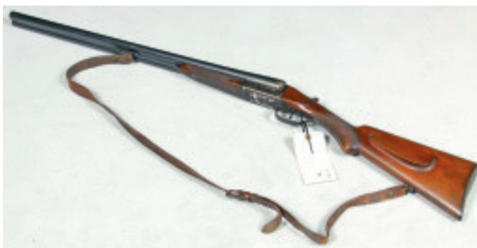
I den kommende sæson kan besøgende på Kaj Munk Museet i Vedersø Præstegård se det ene af Kaj Munks gamle jagtvåben, et Rex-haglgevær i kaliber 12.