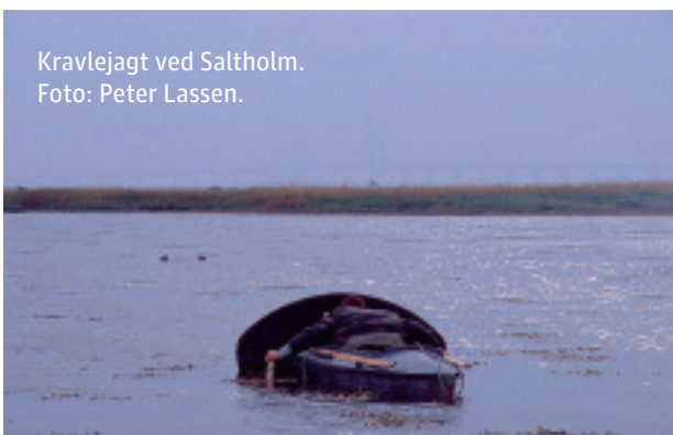
Kravlejagt ved Saltholm.

De bornholmske jægere lader sig tilsyneladende ikke nøje med den trofæjagt, øen kan byde på. Der blev opmålt rigtig mange udenlandske trofæer, lige fra kronhjort, då- og sikahjort, råbuk og vildsvin.