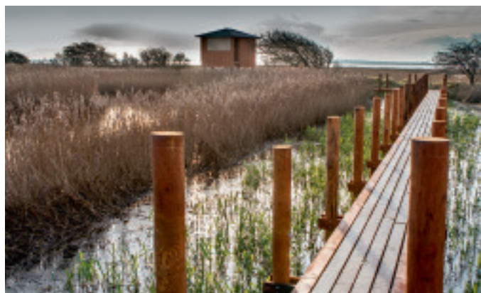
Det nye udsigtstårn er endnu ikke færdigt her på fotoet, men det stod færdigt i løbet af januar.