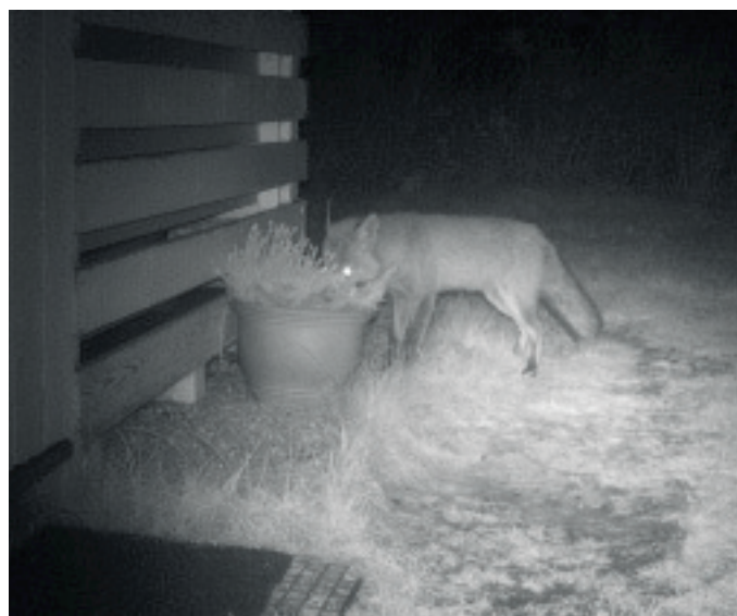
Den røde røver kommer hver nat og snupper et eller flere æbler i krukkerne.