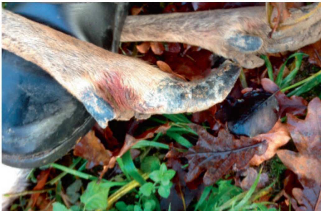
Snabelsko er en sjælden misdannelse af klovene.

Råen viste sig ikke bare at have snabelsko, den var også usædvanlig gammel. Tænderne var næsten slidt ned til gummene. - Det er da lidt pudsigt, at jeg skal starte med at skyde en rå med snabelsko, når de nu er så sjældne, slutter Steen.