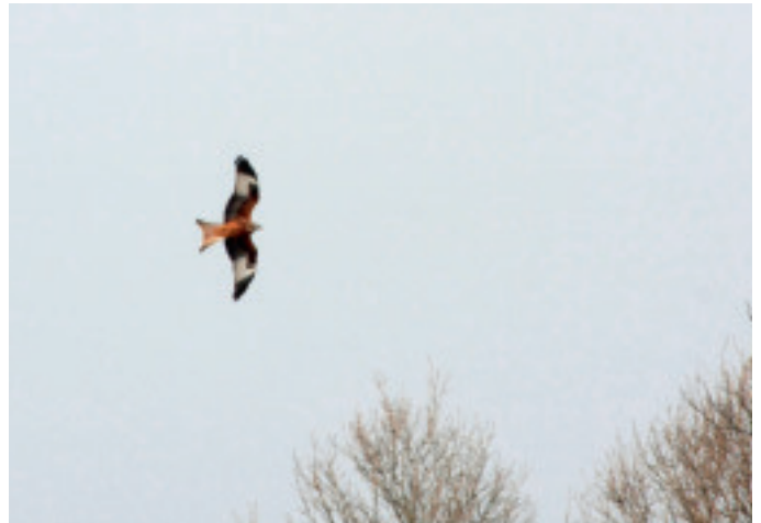
Den røde glente er ådselæder og kan risikere at dø efter at have ædt giftdræbte rotter.

Efter en del diskussion valgte Lolland Kommune at droppe rottegiften og i stedet bekæmpe rotterne med fælder. De skal til gengæld efterses mindst hver anden dag, og det vil naturligvis give kommunen en ekstra udgift. Til gengæld kan rovfugle og rovdyr nu hjælpe til med rottejagten uden at risikere at blive forgiftede.