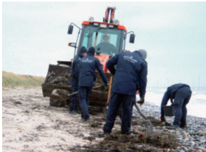
Værnepligtige fjernede olieklumper fra stranden på Sydloolland.