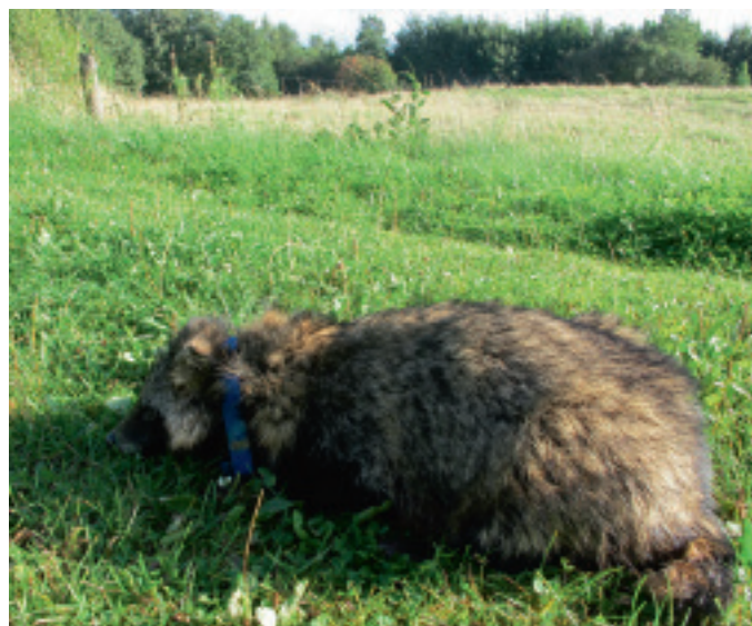
Mårhunden forstår at „spille“ død, når den føler sig trængt, og det gør den nemmere at fange.