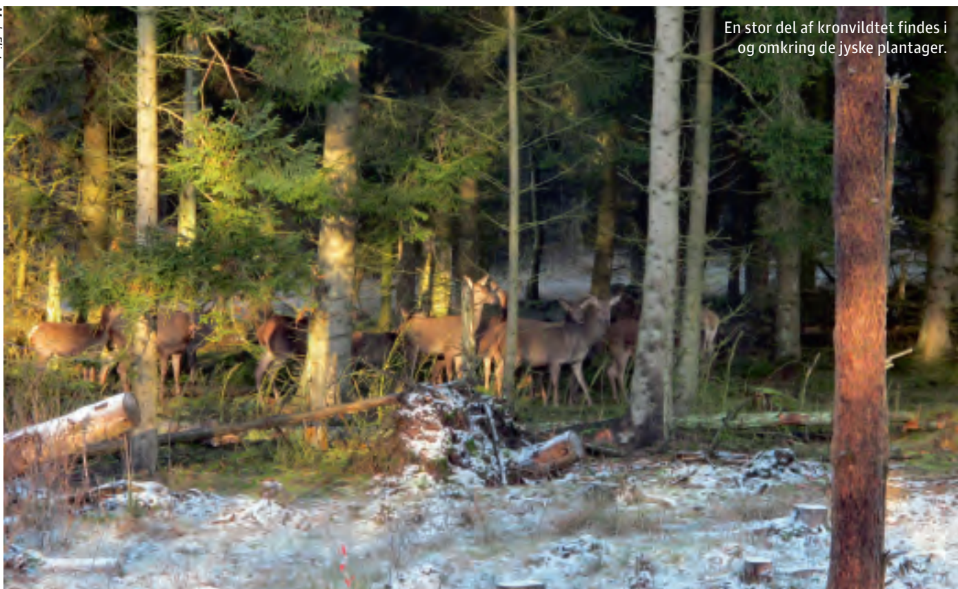
En stor del af kronvildtet findes i og omkring de jyske plantager.

En forårsbestand som den, der er opgjort af de regionale grupper, giver en bestand før jagtsæsonen på over 25.000 krondyr. Der har aldrig været