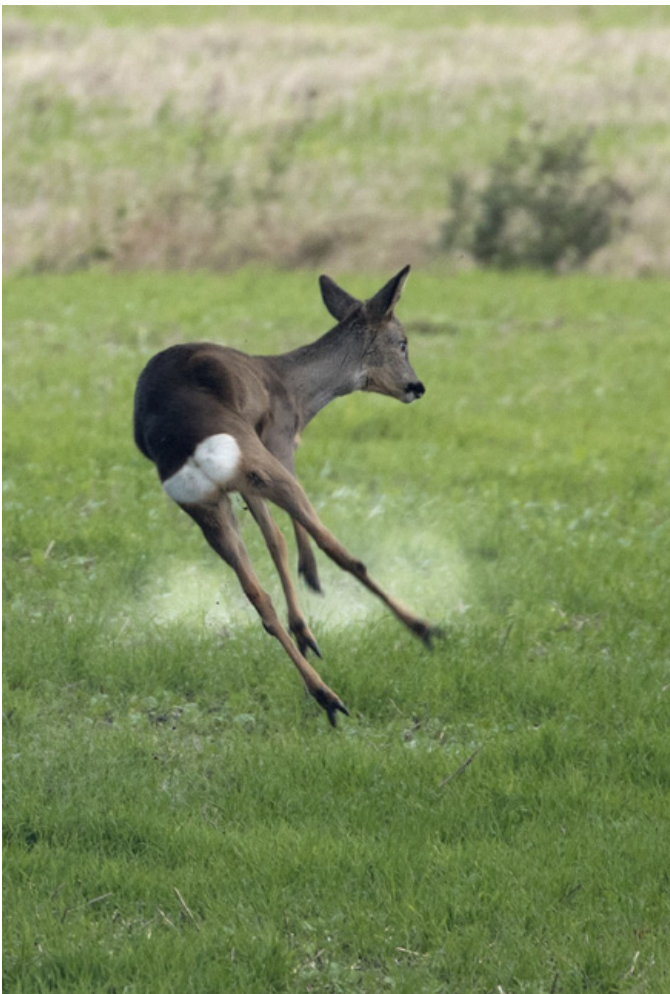
Har råen ikke skiftet til vinterpels først i oktober, nedlægges hun. Dette betyder, at evt. gode lam også må holde for, hvis moderdyret ikke er sundt. Her tegner et ellers flot lam for en god kugle.