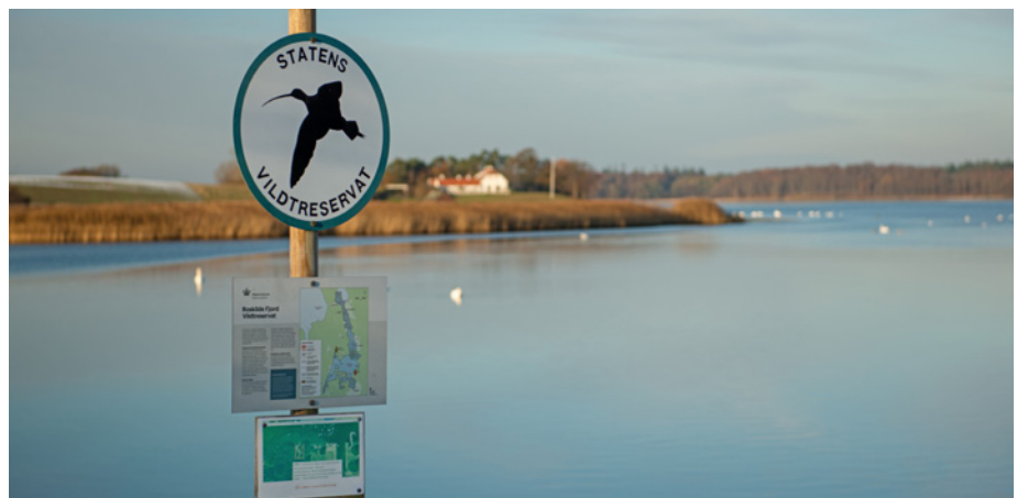
Som konsekvens af køkkenbordsforliget blev der oprettet en lang række vildtreservater i samarbejde med de lokale aktører.

Dette var afslutningen på historien om køkkenbordsforliget og Vildtforvaltningsrådets arbejde i de efterfølgende år. På et senere tidspunkt vil vi her i bladet dykke ned flere aspekter af den nyere danske jagthistorie. klj@jaegerne.dk