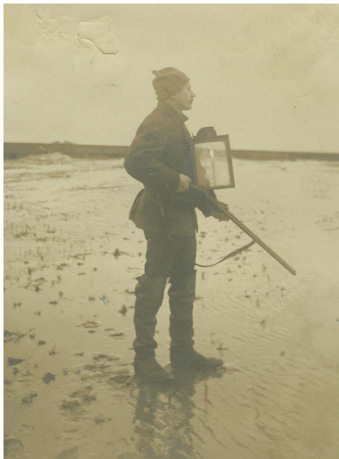
Indskrænkningerne i en lille mands jagt ved kysten betød, at Landsjagtforeningen af 1923 blev dannet.