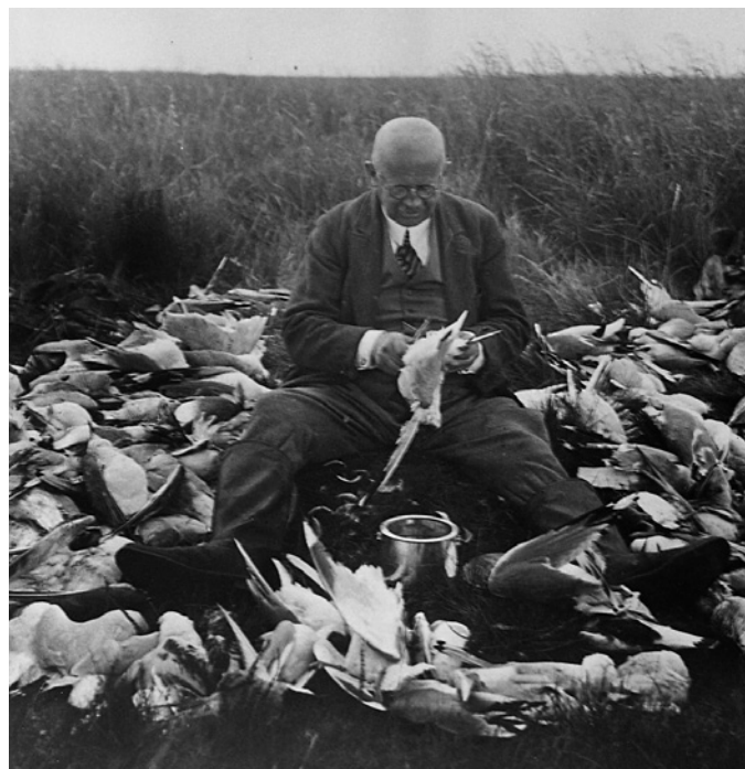
Mange steder var jagttrykket for højt, hvilket var en torn i øjet på ornitologerne. Arkivfoto.

Striden mellem organisationerne betød, at Vildtforvaltningsrådet blev dannet i 1979 som supplement til Jagtrådet, som indtil da stort set havde dikteret al lovgivning inden for jagt- og vildtforvaltning. I de første år havde Vildtfor-