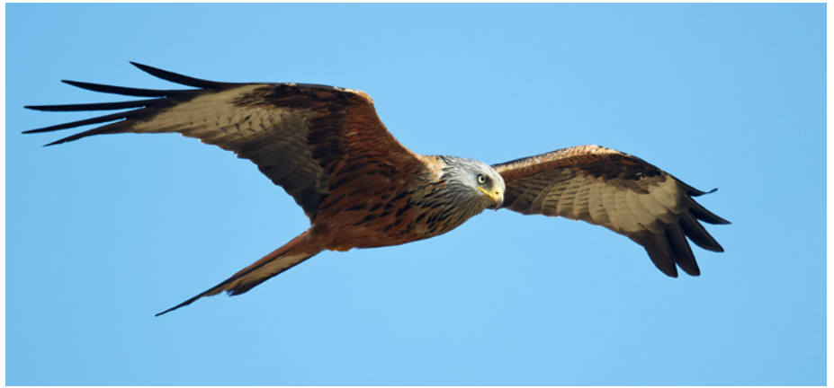
Rovfuglene var langt op i 1900-tallet fredløse. Glenten blev eksempelvis udryddet, men den er heldigvis kommet tilbage.