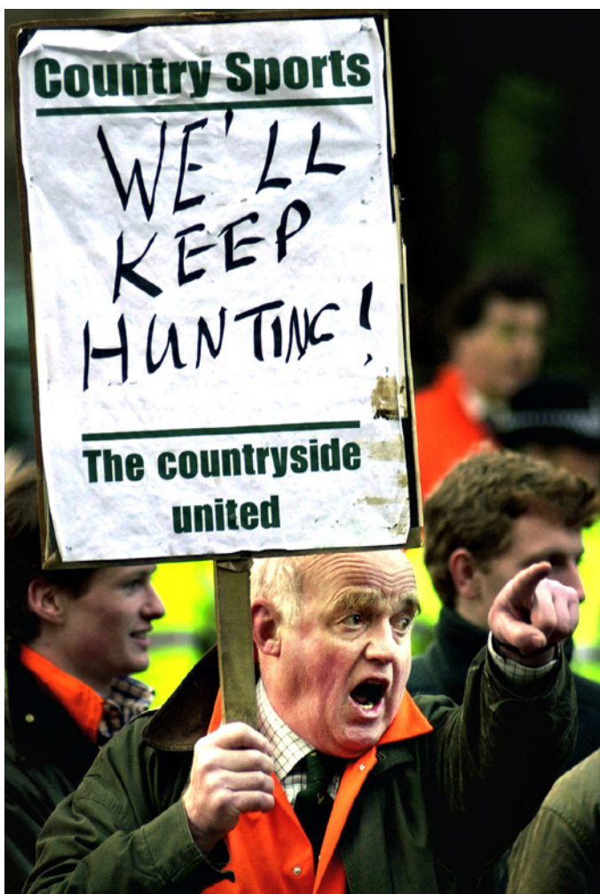
I 80'erne foregik der mange happenings orkestreret af jagtmodstanderne, men det kom aldrig til voldelige sammenstød mellem jægere og ikke-jægere – i modsætning til hvad tilfældet ellers har været i mange europæiske lande. Billedet er fra Skotland.

en række områder, hvor motorbådsjagt ikke længere skulle være tilladt, så fuglene kunne have nogle steder, hvor de kunne raste i fred. Det blev gennemført i 1988.