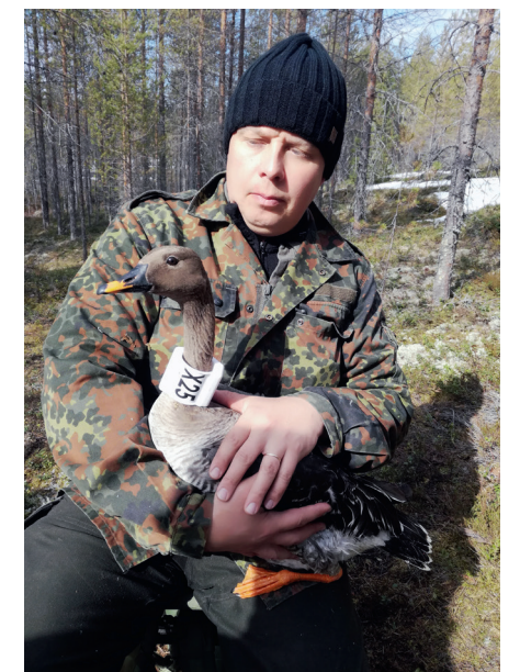
En gruppe finske jægere har de senere år bidraget aktivt til fangst og ringmærkning af ynglende tajgasædgæs. Denne gås er desuden blevet forsynet med en GPS-sender.